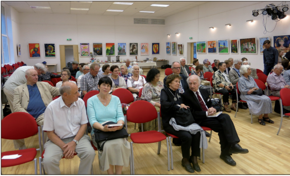
Knygos sutiktuvės Karininkų ramovėje, Vilniuje.