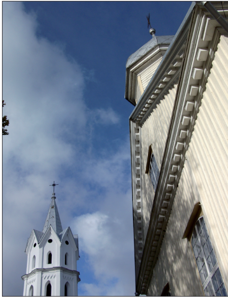
Svėdasų Šv. arkangelo Mykolo bažnyčia ir varpinė.

O kur mūsų miestelio diena, kur visus po pasaulį išsiblaškusius svėdasiškius sutraukianti į tėviškę šventė?