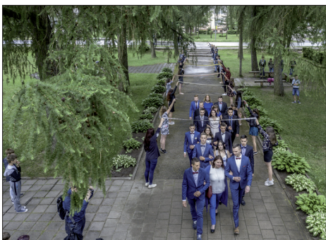
Paskutinis skambutis kviečia į klasę

Kiekvieną pavasarį dvyliktokų širdyse atsiranda daugiau džiaugsmo, kartu ir nerimo. Priežastis – artėjantis paskutinis skambutis. Gegužės 23 dieną šią gražią ir prasmingą šventę pažymėjo Svėdasų Juozo Tumo-Vaižganto gimnazijos LXX laidos abiturientai. Jų šiemet 18.