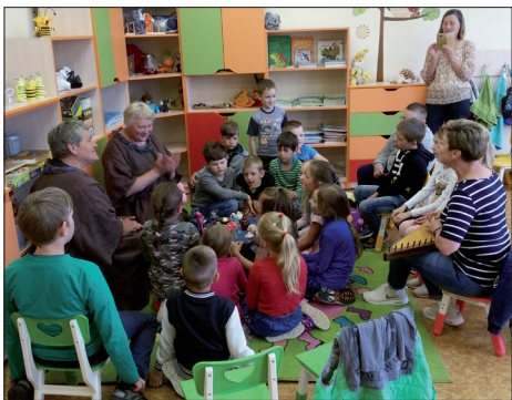
Vaikučiai ne tik klausėsi sekamos pasakos „Erškėtrožė“, bet ir ją vaidino

Gegužės 15-ąją, šeimos dienos proga, Svėdasų ikimokyklinio, priešmokyklinio amžiaus ir pirmos klasės vaikučius aplankė viešnios iš Ažuožerių bibliotekos meno mylėtojų kolektyvo. Jos atvežė įvairiausiai kvapais kve-