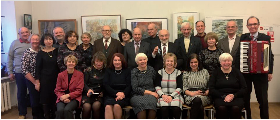
Draugijos šventinės popietės dalyviai.

Sausio 6 dieną Svėdasiškių draugijos „Alaušas“ nariai rinkosi Vilniaus karininkų ramovėje. Čia vyko tradicine tapusi Trijų Karalių šventinė popietė. Kaip jau esame įpratę, susirenkame prisiminti praėjusius metus, pasitarti dėl naujų sumanymų naujiesiems. Apie tai kalbėjo draugijos pirmininkė.