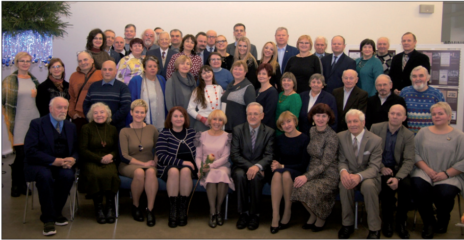
Sutiktuvių Anykščiuose organizatoriai ir svečiai.