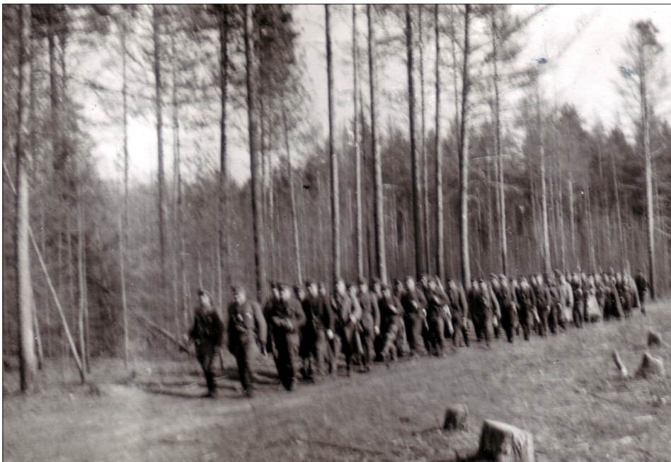
Algimanto apygardos Šarūno rinktinės partizanai žygiuoja per plačiąją kirtimo liniją Šimonių girioje

2014-ųjų rudenį bendradarbiaujant Lietuvos gyventojų genocido ir rezistencijos tyrimo centrui, Anykščių rajono savivaldybei bei tuo metu buvusiai VĮ Anykščių miškų urėdijai, Šimonių girioje buvo įrengtas naujas pažintinis maršrutas „Algimanto apygardos partizanų kovų takais“. Keliaudami pažintiniu maršrutu lankytojai gali aplankyti buvusios Rytų Lietuvos (Karaliaus Mindaugo) vadavietės vietą, Algimanto apygardos vadovybės slėptuvę (bunkerį), kitas buvusių partizanų slėptuvių (bunkerių) vietas, taip pat kapines, kuriose palaidoti Algimanto apygardos partizanai. Pakeliui yra įrengti 4 informaciniai stendai, kuriuose pateikiama informacija apie lankomus objektus. Stenduose esantys taškiniai QR kodai suteikia galimybę lankytojams prisijungti prie Lietuvos gyventojų genocido ir rezistencijos tyrimo centro svetainės puslapio ir pasiskaityti išsamesnę informaciją apie lankomą objektą. Kad lankytojams būtų lengviau surasti objektus, pastatytos maršruto kryptį nurodančios rodyklės, vietose, kur nėra galimybės prie lankytino objekto privažiuoti automobiliu arba dviračiu, maršrutas pažymėtas simboliais ant medžių.