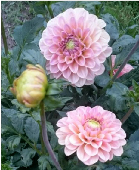
Jurgino „Tumas Vaižgantas“ žiedai.