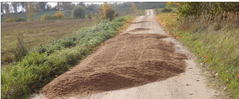
Žvyruojami Svėdasų seniūnijos keliai