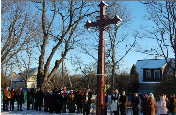
Ką tik Kunigiškiuose pastatyto, gražiai atrodančio, rūpestingai sumeistrauto kryžiaus šventinimo akimirka 2008 m. sausio 5-ąją