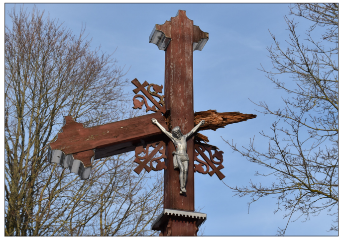
Taip neseniai atrodė Kunigiškių kaimo kryžius, suniokotas praūžusios vėtros

„Svėdasų varpe“ prieš kurią laiką rašėme apie sausio 14-ąją stiprios audros apgadintą 2005 metais kryžkelėje lietuvių literatūros klasiko kanauniko Juozo Tumo-Vaižganto gimtojo Malaišių kaimo link pastatytą medžio skulptūrą. Gamtos stichija tuomet nuo masyvios ąžuolinės skulptūros nurovė ir ant žemės nubloškė didžiulę lentą su užrašu „Malaišiams – 750 metų“.