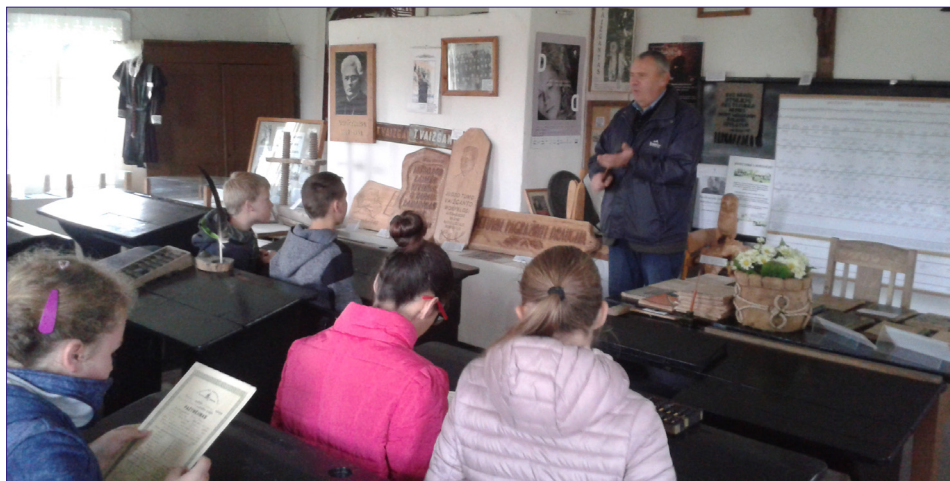
Netradicinė pamoka muziejuje

Jau keletą metų, minint Vaižganto gimtadienį, mūsų gimnazijoje organizuojama netradicinio ugdymo diena.