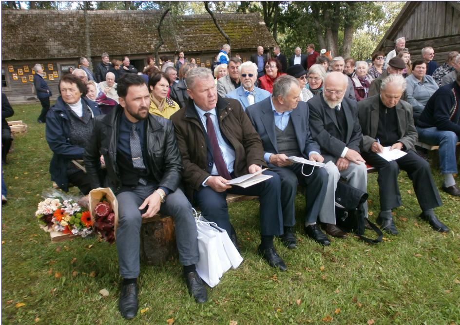
Šventės dalyviai.

Pavakare šventinis šurmulys, palikęs visiems gražių sueities tėviškėje prisiminimų, ėmė tilti, o „Vaižgantinių“ šventės laužas... pamažu išblėso.