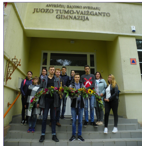
Abiturientai neša gėles Vaižgantui

Per penktą pamoką stadionas tarsi atgijo. Krepšinio aikštelėje kariavo vyresnių klasių mokiniai – vyko krepšinio maratonas. Kūno kultūros mokytojų vadovaujami jaunesni mokiniai dalyvavo pasagos mėtymo var-