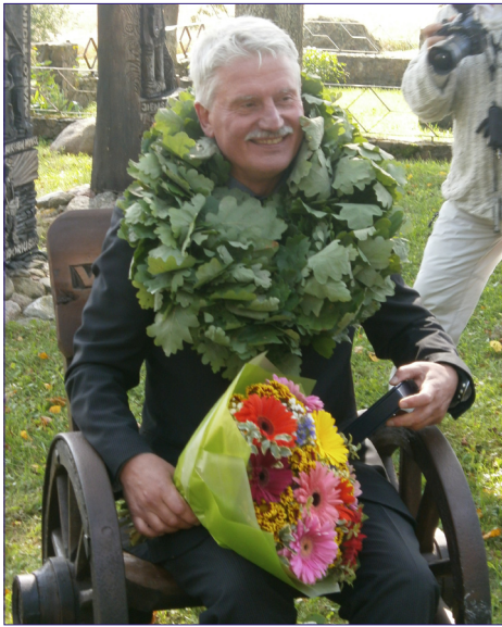
E. Aleksandravičius