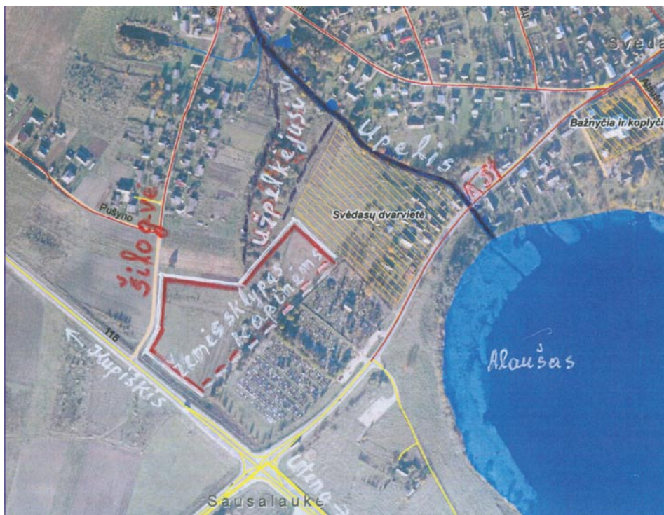
Esamas kapinės galima plėsti šiaurės vakarų kryptimi

Šie darbai neįeitų į Svėdasų miestelio dalinį sutvarkymą, o skirtingose vietose įrengtos kapinės šeimoms sudarytų ne tik nepatogumų ir nemažų sunkumų;