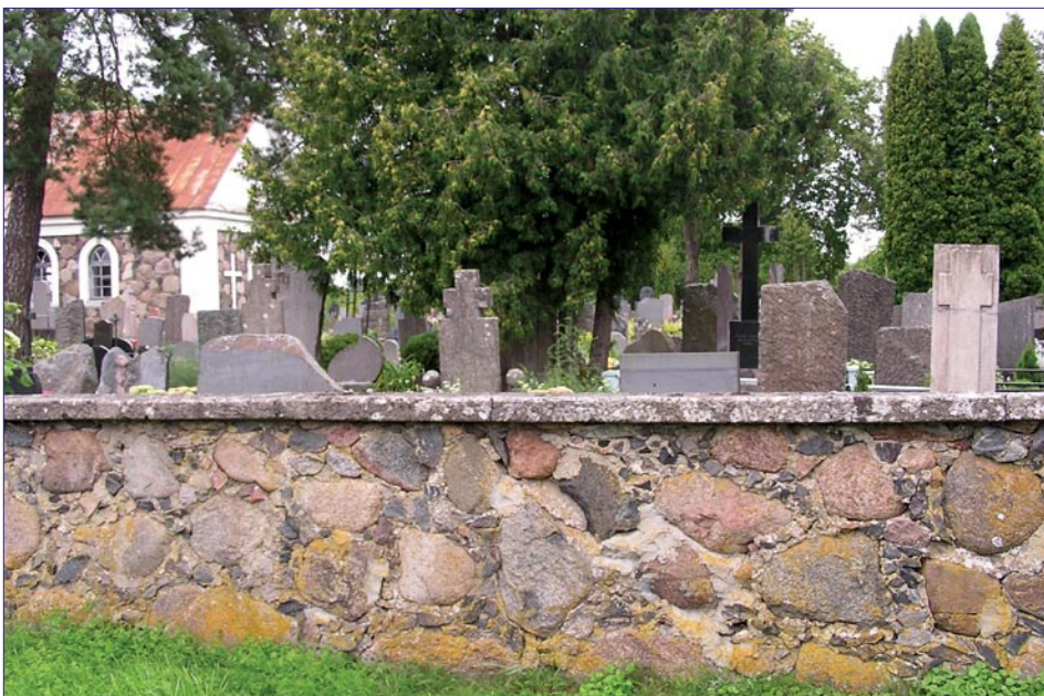
Kapinių mūro siena – tinkama vieta kolumbariumui

4) netikslinga skirti joms žemės sklypą ir žymiai toliau Svėdasų kapinių, nes įrengimas ir infrastruktūros sutvarkymas būtų per brangus: reikėtų nutiesti kelią, įrengti mašinų stovėjimo aikštę, atvesti elektros liniją, pastatyti koplųtelę, kapines aptverti, parengti jų planą, skirti administratorių ir kt.