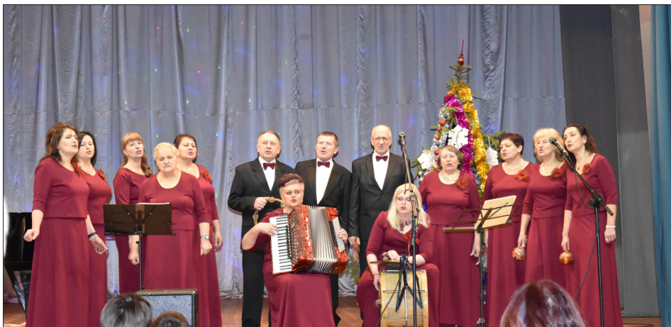
Svėdasiškių kapela – irgi gerai žinomas, visuomet renginiuose laukiamas, plojimai sutinkamas kolektyvas