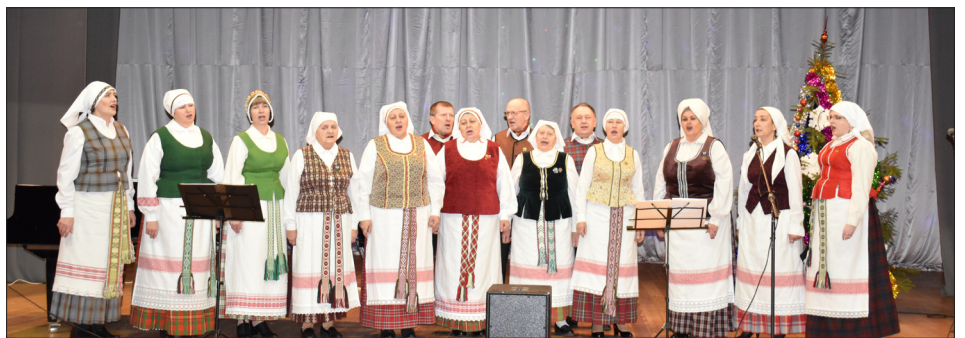
Šventinį renginį „Viskas prasideda tavimi“ pradėjo folklorinis ansamblis

Šventinį koncertą pradėjo tautiškais kostiumais pasipuošę folklorinio ansamblio dalyviai, atlikę keletą gerai žinomų lietuvių liaudies dainų. Po to populiarias dainas žiūrovams dovanojo vokalinis ansamblis, mišrus vo-