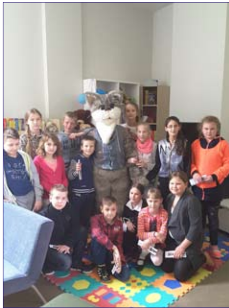
Svečiuose pas Katiną Katulį