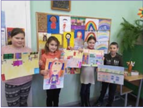
Konkurso „Knygų namų šviesa“ dalyviai

2016-aisiais metais Anykščių r. Svėdasų Juozo Tumo-Vaižganto gimnazijos biblioteka organizavo bibliotekų metams skirtus renginius. Mokiniai dalyvavo Lietuvos vaikų neformaliojo švietimo centro organizuojamose veiklose: ketvirtokai – meninės kūrybos konkurse „Knygų namų šviesa“, penktokai įsitraukė į pilietinę akciją „Mano nuveikti darbai bibliotekoje“. Pradinių klasių ir II gimnazijos klasės mokiniai buvo išvykę į Anykščių rajono savivaldybės Liudvikos ir Stanislovo Didžiulių viešąją biblioteką, kurioje susipažino su jos veikla bei apsilankė „Katino svetainėje“.